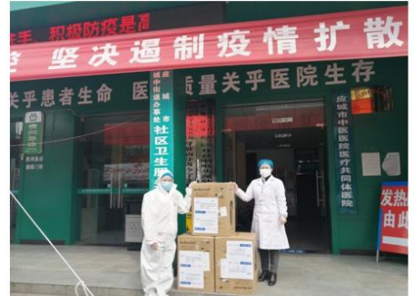
急需医疗设备送达各对接医院