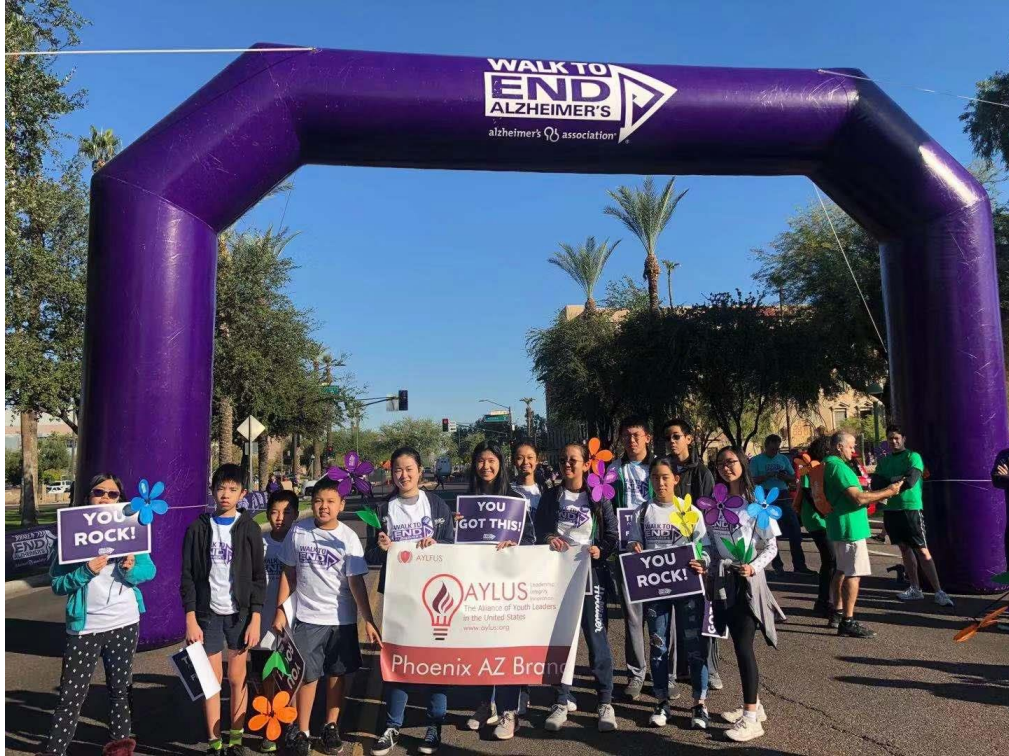
2019 抵抗和为阿兹海默症（老年痴呆症）的研究众筹义工活动。