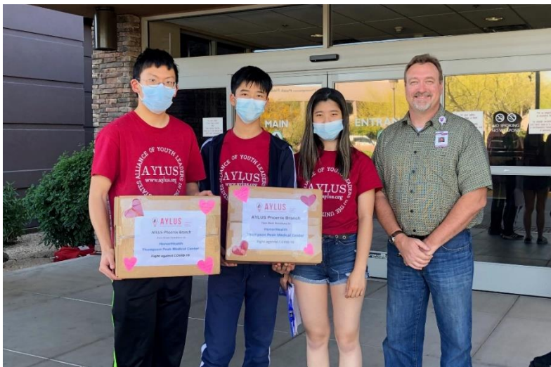
Thompson Peak Medical Center