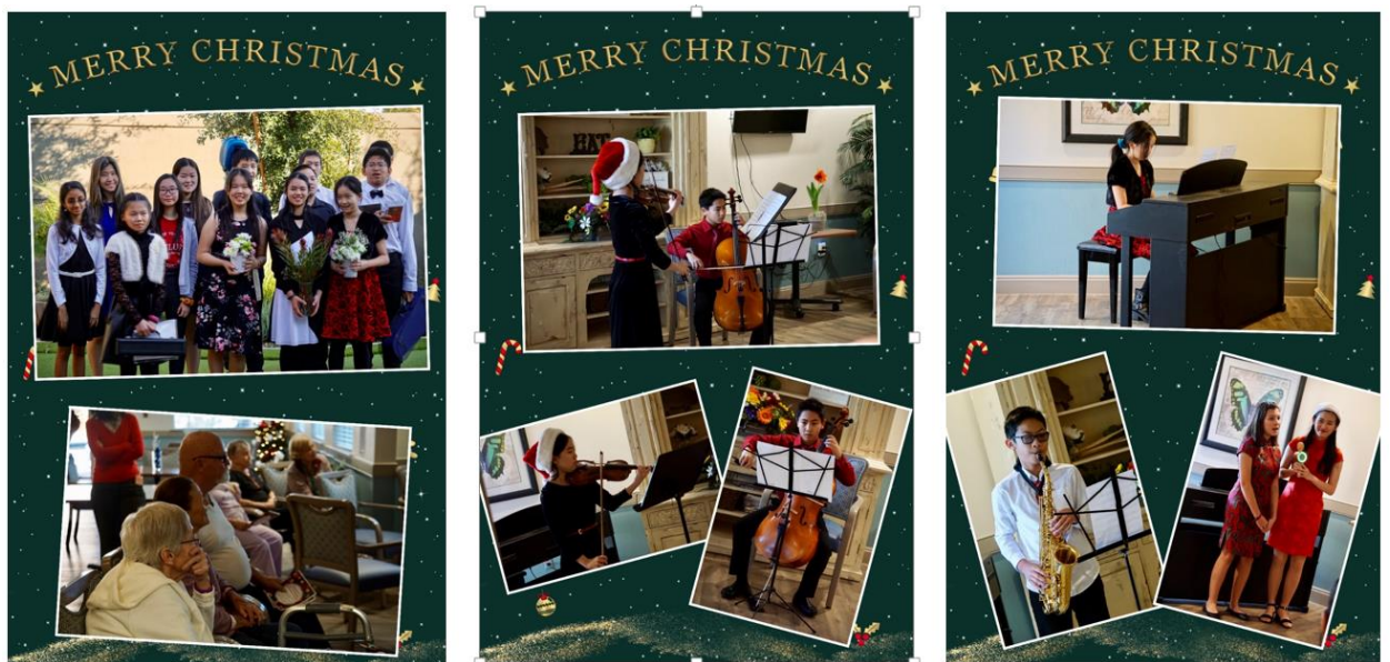
2019 老年中心圣诞节义演专场