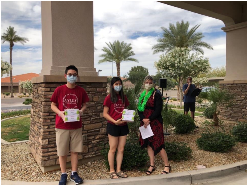
Gardens at Cotillo Senior Living