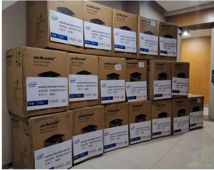
医用紫外消毒净化机