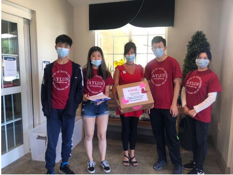
Enclave Gilbert senior Center