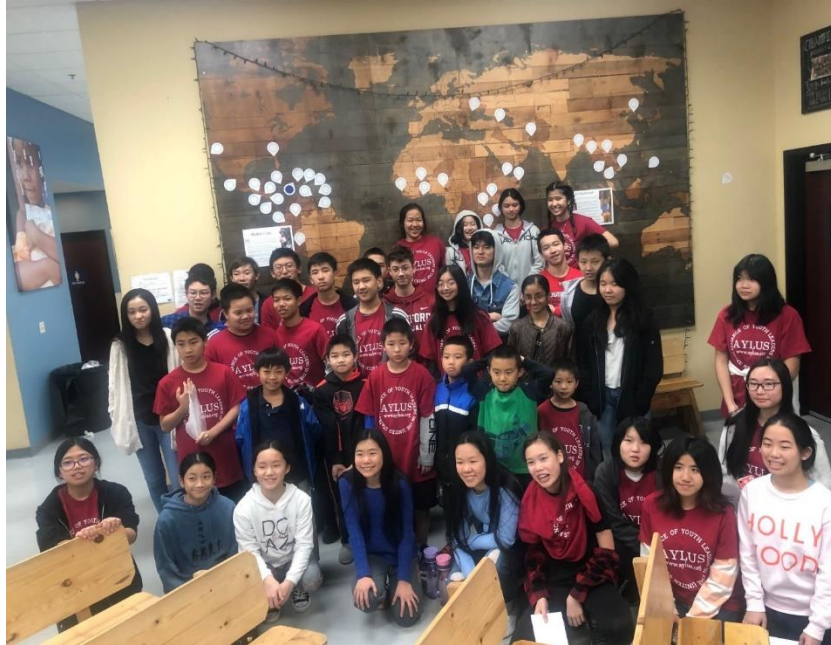
Feed my starving children