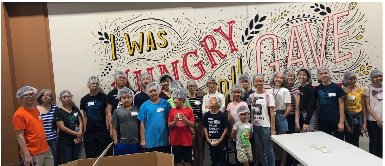
Midwest food bank