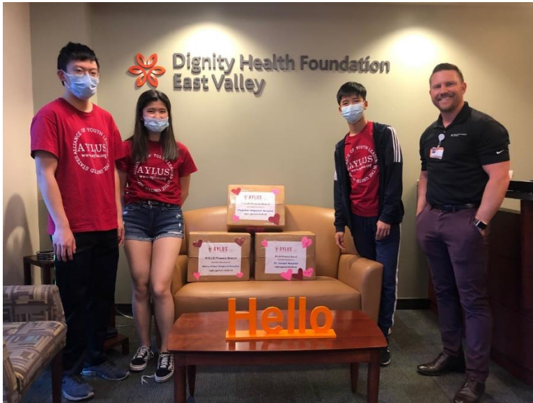
Dignity Health Foundation